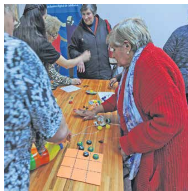
Más de 1.500 personas, 20 stands y actividades a cargo de las/os beneficiarias/os