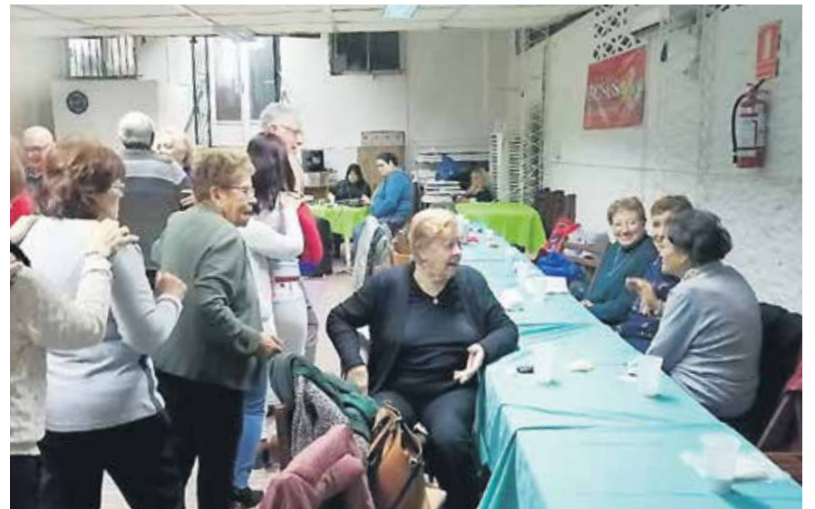
ONAJPU participó de la Noche de la Nostalgia en el local de los jubilados y pensionistas de CUTCSA.