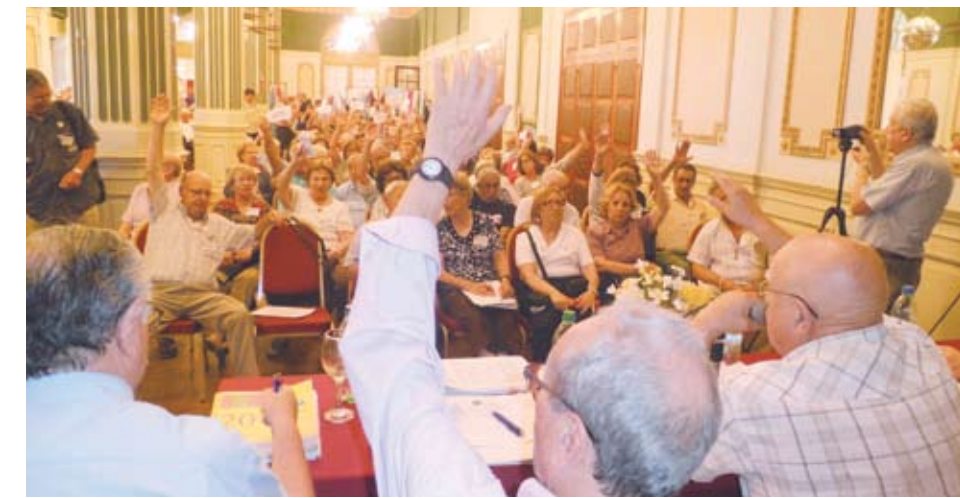
Los informes fueron votados afirmativamente por unanimidad.